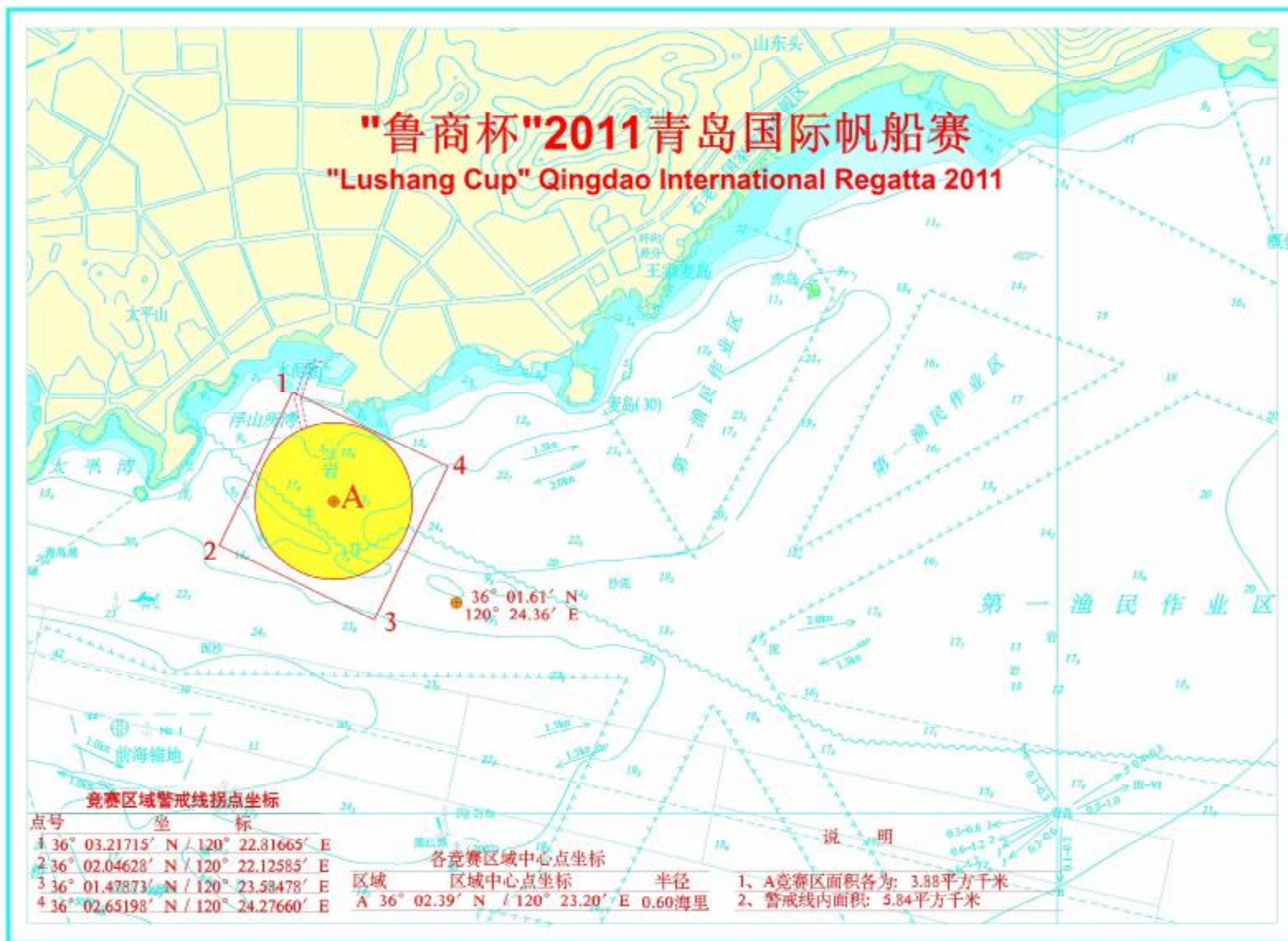
附录 2: 场地赛竞赛场馆及水域示意图